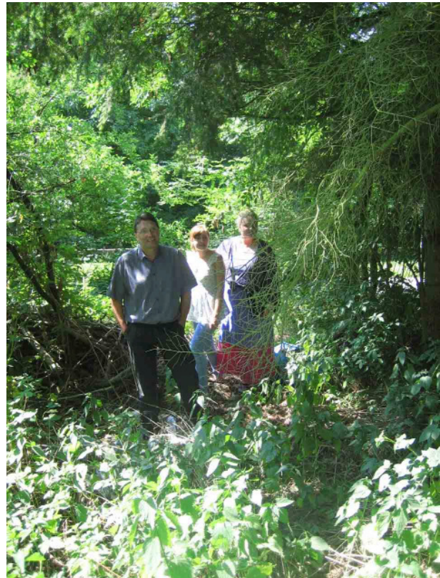
Die „Dorferneuerer“ außerhalb des Gestrüpps